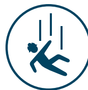
FALL FRÅN HÖJD