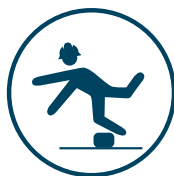
FALL I SAMMA NIVÅ