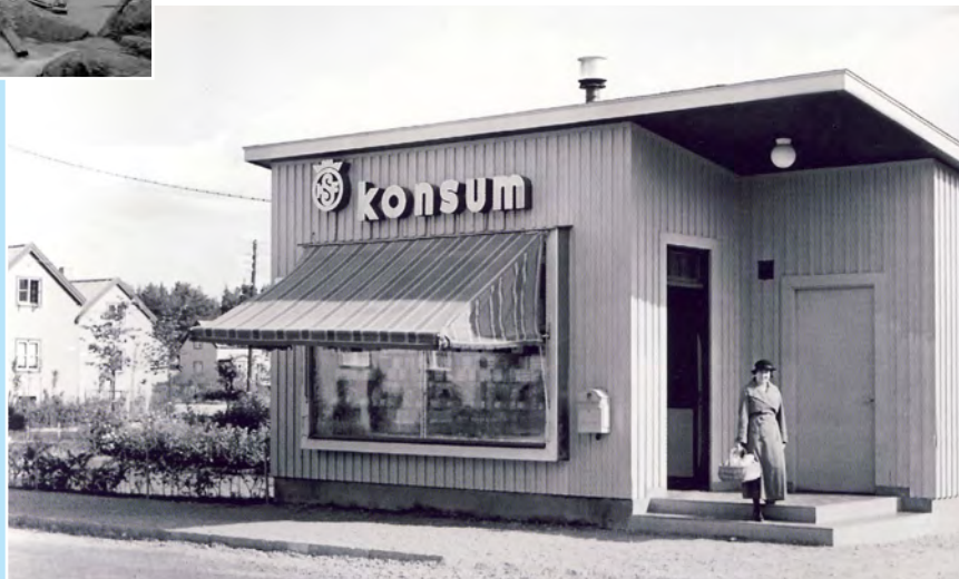
Okänd, KF:s arkiv