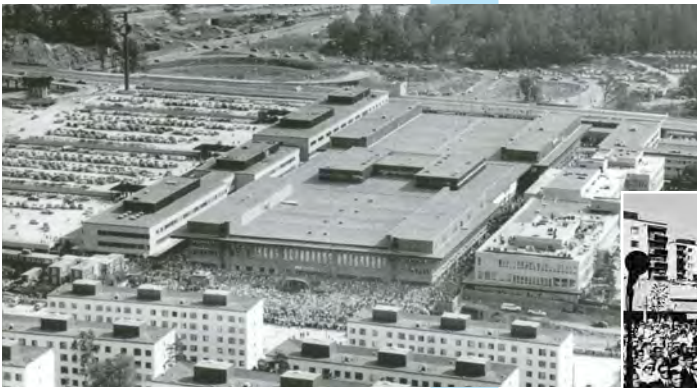
Okänd, Coggs bildbyrå U. Simonsson, Stadsmuséet i Stockholm