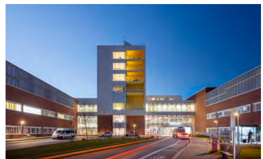
C.F. Möller Architects / Julian Weyer

Ett av de senaste jobben är Drammens sjukhus i Norge, ett projekt med ett starkt fokus på hållbarhet i flera dimensioner, vilket stämmer väl överens med Bravidas hållbarhetsstrategi. Drammens sjukhus ska vara klart 2025. Parallellt med nybyggnationer av sjukhus är Bravida också ledande inom teknisk fastighetsdrift och sköter därför driften av flera regionsjukhus från norr till söder i Sverige.